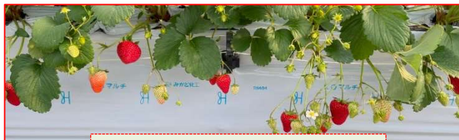
ストロベリーパーク みふね