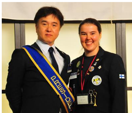
〈武山会長と記念撮影〉